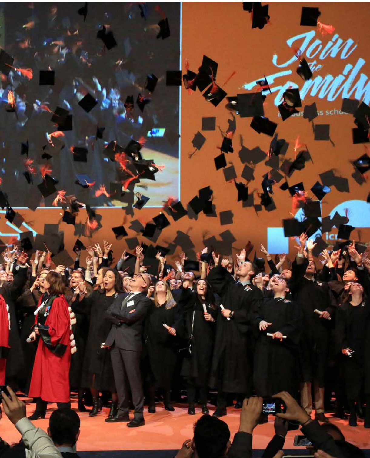
Plus de 300 élèves du programme Grande école réunis sur scène. L'un des grands moments de la cérémonie de remise des diplômes.