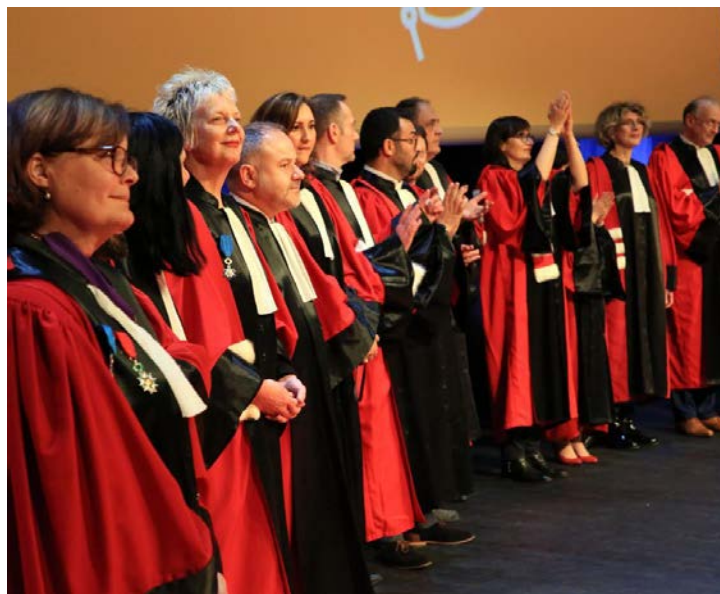
C'est sous les applaudissements de leurs désormais ex-élèves que les professeurs de l'ICN sont montés sur la scène du centre des congrès.