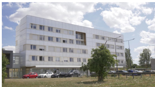
Vue avant - depuis l'accès parking du LEM3

Hôtel centre ville : https://www.tourisme-metz.com/fr/preparer-son-sejour/hotels-a-metz