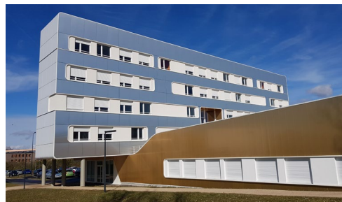
Vue arrière depuis la route d'Ars Laquenexy