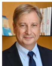
François Grosdidier Maire de Metz / Président de l'Eurométropole de Metz Vice-Président de la Région Grand Est / Membre honoraire du Parlement