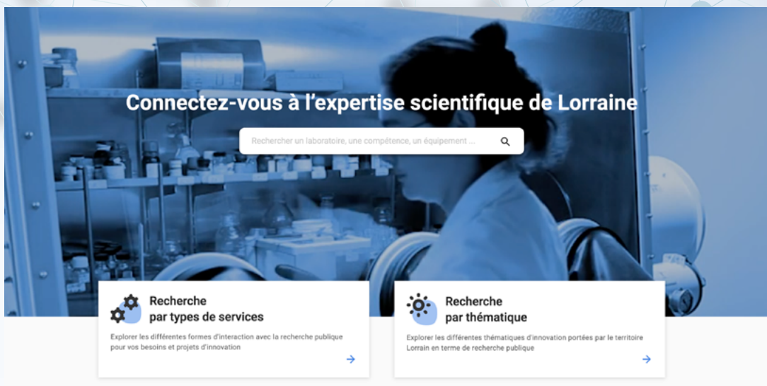
Figure 1 Moteur de recherche par mots clés, par thématiques, par type de service

En complément du portail Plug in labs Lorraine, il est possible de visualiser la répartition des infrastructures de recherche sur le territoire lorrain dans une cartographie à cette adresse : https://www.univ-lorraine.fr/lue/infra/