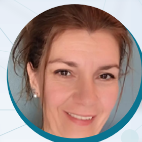
Katalin SELMECZI PhotoNS – L2CM

Le plateau technique PhotoNS rassemble les techniques de spectroscopie (Absorbance en UV/Vis/NIR, Fluorescence stationnaire ou résolue dans le temps, RAMAN, Dichroïsme Circulaire, FTIR), de caractérisation de nanoparticules (mesure de taille et potentiel Zêta par DLS ou NTA) ainsi que les mesures sur des dispositifs photovoltaïques (courbe I/V pour rendement et IPCE). Nous sommes spécialisés dans les études des interactions moléculaires, en solution ou aux interfaces air/liquide.