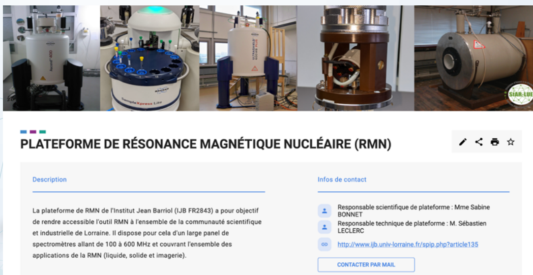
Figure 3 Exemple d'une fiche infrastructures de recherche présentant trois onglets : offre de service et de formation, équipements et technologies, environnement institutionnel