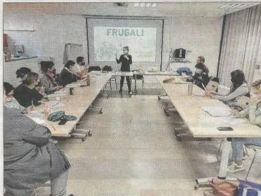
Une formation très appréciée.

le nombre d'enfants qui fréquentent les 5 restaurants scolaires de la ville.