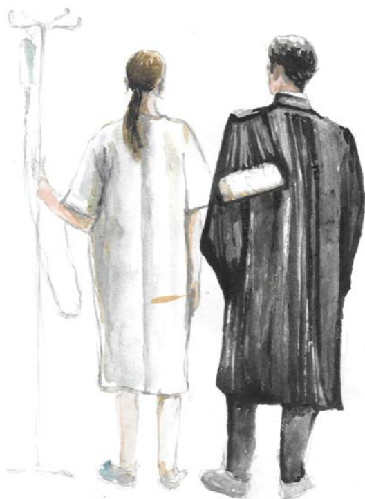
Illustration : Juliette Villars

sous la direction du Professeur Bruno Py