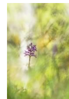
« Peinture florale » LAMANT Euridice