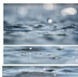
« Les ondes » ZANINO Jean-Louis