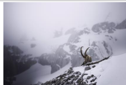
« Les funambules de l'hiver » PALOMARES Charline