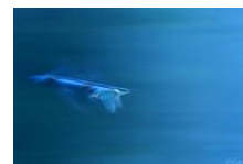
« Martin couleur » COSTERMAN Marc