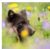
« Rencontres Sauvages » LESUEUR Franck