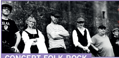
CONCERT FOLK ROCK