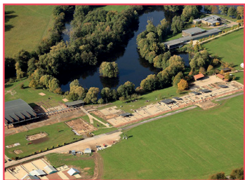
Vue aérienne du Parc archéologique européen de Bliesbruck-Reinheim

Sur le site de Sarreguemines, les JACES 2018 seront consacrées à la période gallo-romaine et menées en partenariat avec le Parc archéologique européen de Bliesbruck-Reinheim.