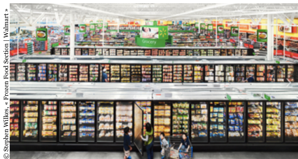
« Frozen Food Section | Walmart »