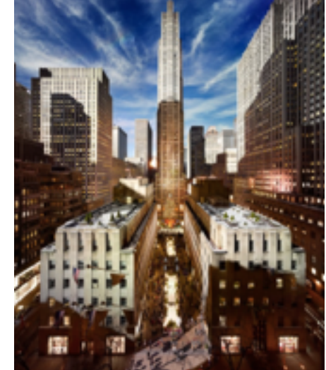
© Stephen Wilkes, « Rockefeller Center, NYC »