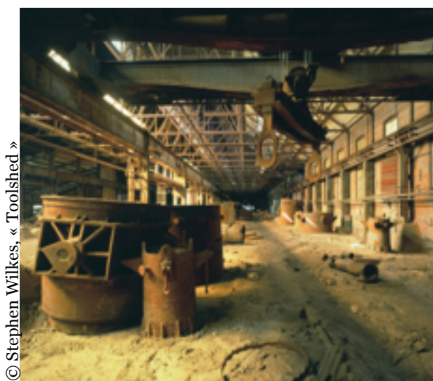
© Stephen Wilkes, « Toolshed »