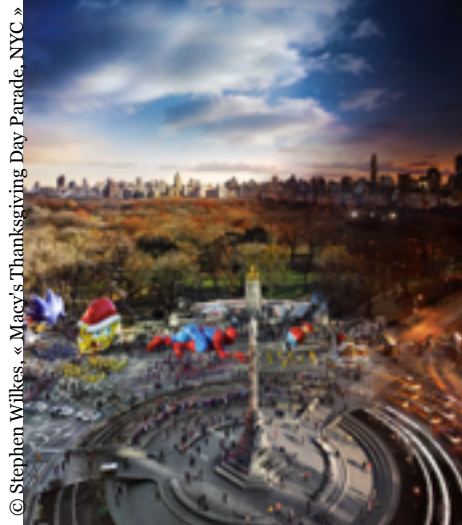
© Stephen Wilkes, « Macy's Thanksgiving Day Parade, NYC »