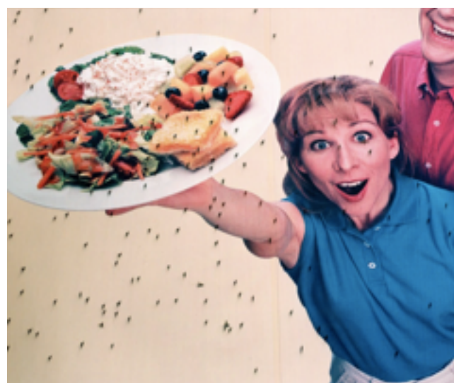
© Stephen Wilkes, « Billboard with flies »