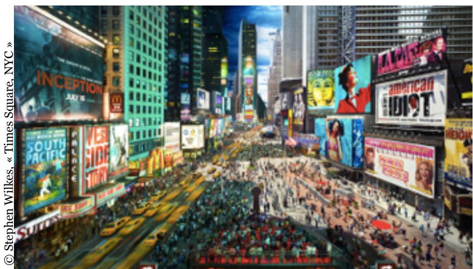
© Stephen Wilkes, « Times Square, NYC »

Docteur en droit et membre du conseil d'administration d'ATTAC