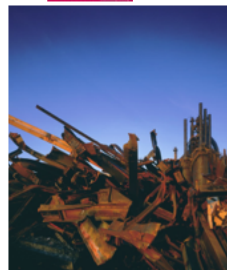
© Stephen Wilkes, « Steel Remains »