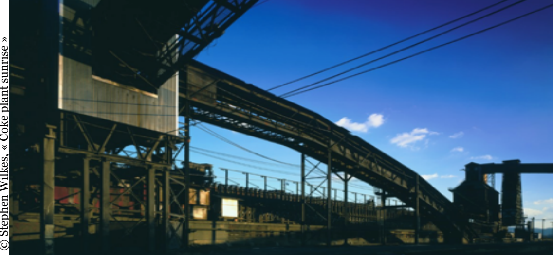
© Stephen Wilkes, « Coke plant sunrise »