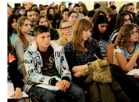
Les Assises

Les journalistes collégiens et lycéens de Lorraine sont réunis aux Assises pour présenter leurs publications et participer aux ateliers qui leurs sont dédiés avec l'association Jets d'encre, le CLEMI et le Groupe Ebra.