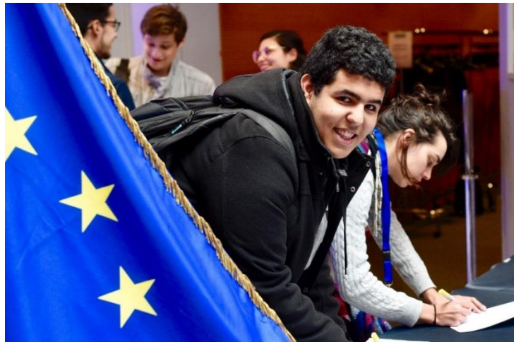
Mois de l'Europe à Strasbourg