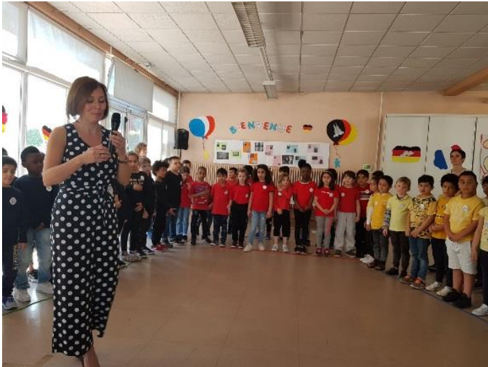
Metz est wunderbar (57)