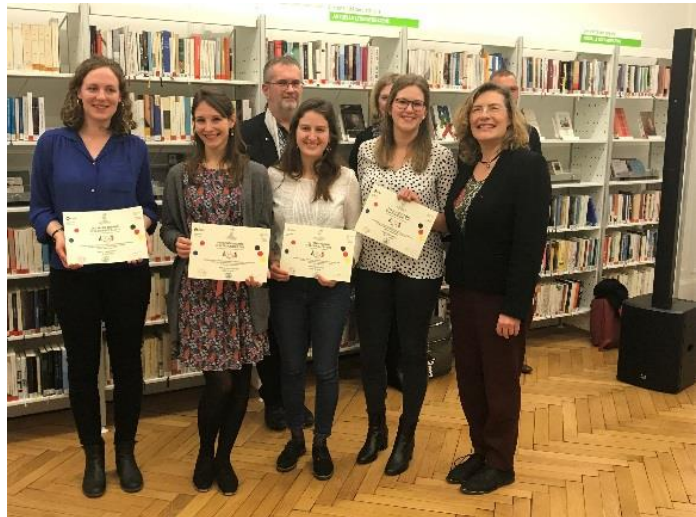
Prix franco-allemand de la chancellerie (54)