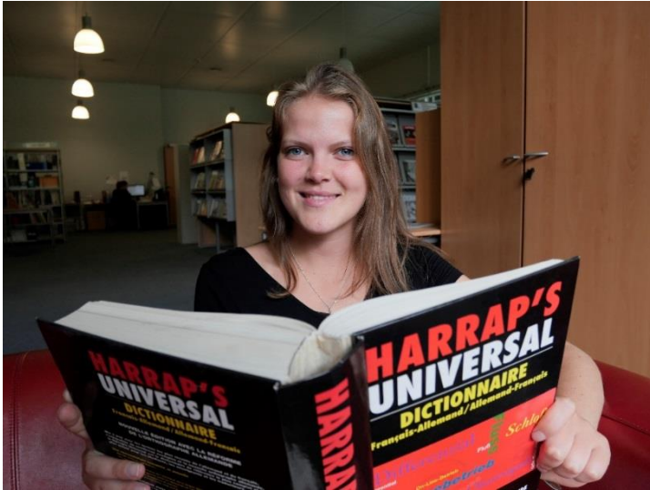
Etudiante – Bilinguisme