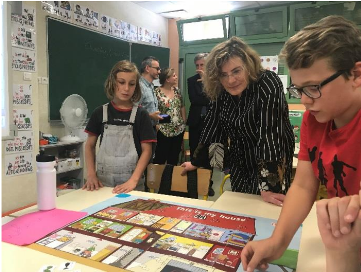
Apprentissage des langues anglaise et allemande au cycle 3 à l'école de Souilly (55)