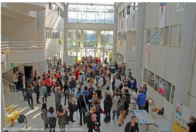
Journée des enseignants de langues (57)