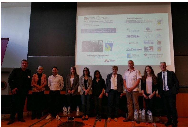
Séminaire franco-allemand d'aide à l'insertion professionnelle